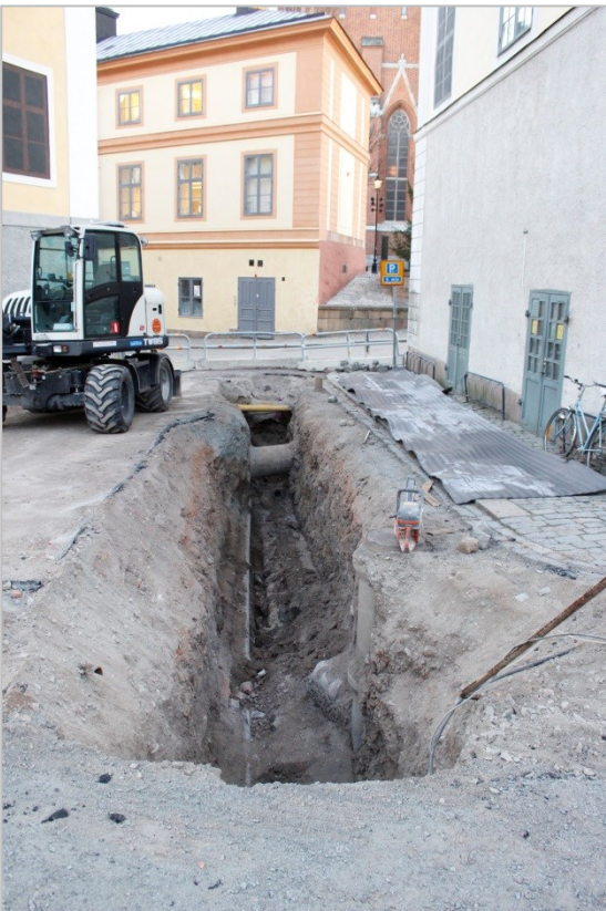
Figur 4. Det färdiggrävda schaktet. På bilden syns flera av de många ledningar som påträffades. Foto mot Ö.