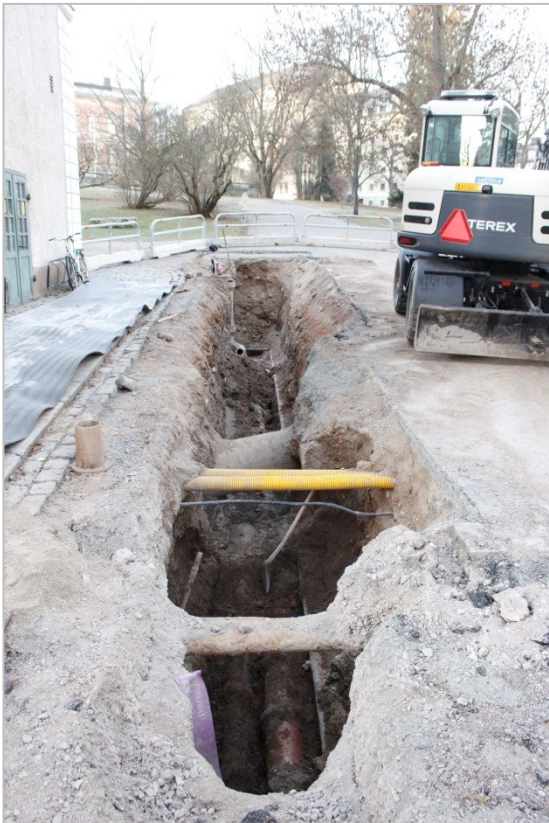
Figur 3. Schaktet grävdes längs med Gustavianums norra gavel. Hela sträckan utgjordes av äldre ledningsschakt på olika nivåer. Foto mot V. Emelie Sunding, Upplandsmuseet.