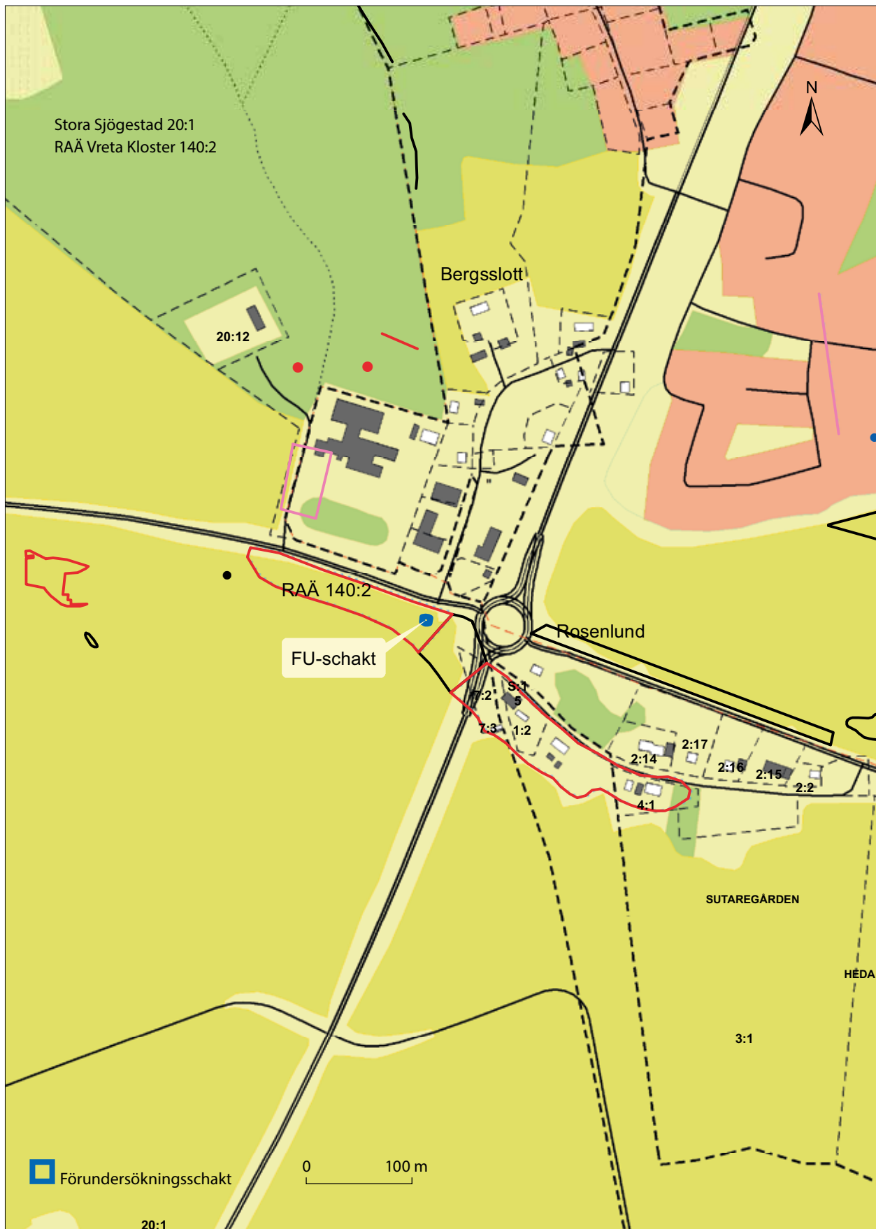
Figur 2. Förundersökningsområdet markerat på utsnitt ur GSD-Fastighetskartan, blad 8F 7g. Skala 1:5000.