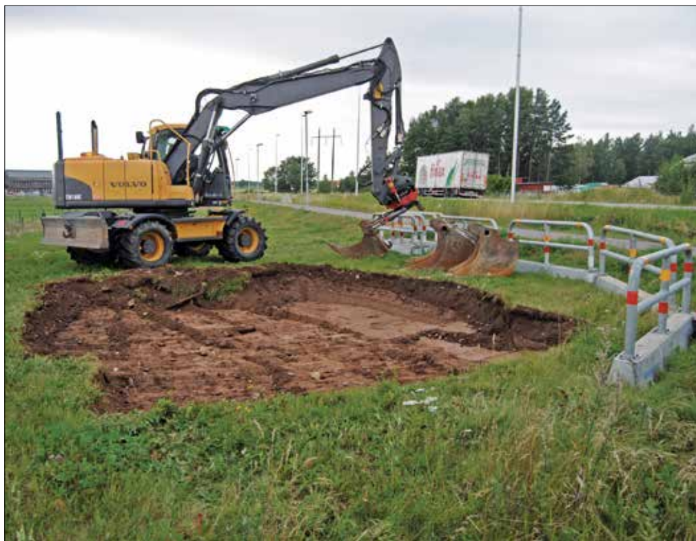
Figur 3. Förundersökningsområdet när matjordslagret har banats av. Fotograferat från öster.

Förundersökningen genomfördes som en schaktningsövervakning, det vill säga att en arkeolog närvarade vid schaktningen. Arbetsområdet utgjordes av ett 7,5x6,7 meter stort område (N-O). Inom området banades matjordslagret av skiktvis under överseende av arkeolog. Större delen av ytan var urschaktad för en tidigare nedlagd vattenledning. Ytan längst i norr var dock orörd. Matjorden i denna del bestod av 0,3 meter tjock, sandig och grusig humus. Under matjorden vidtog opåverkad mark bestående av ljusbrun grusig sand.