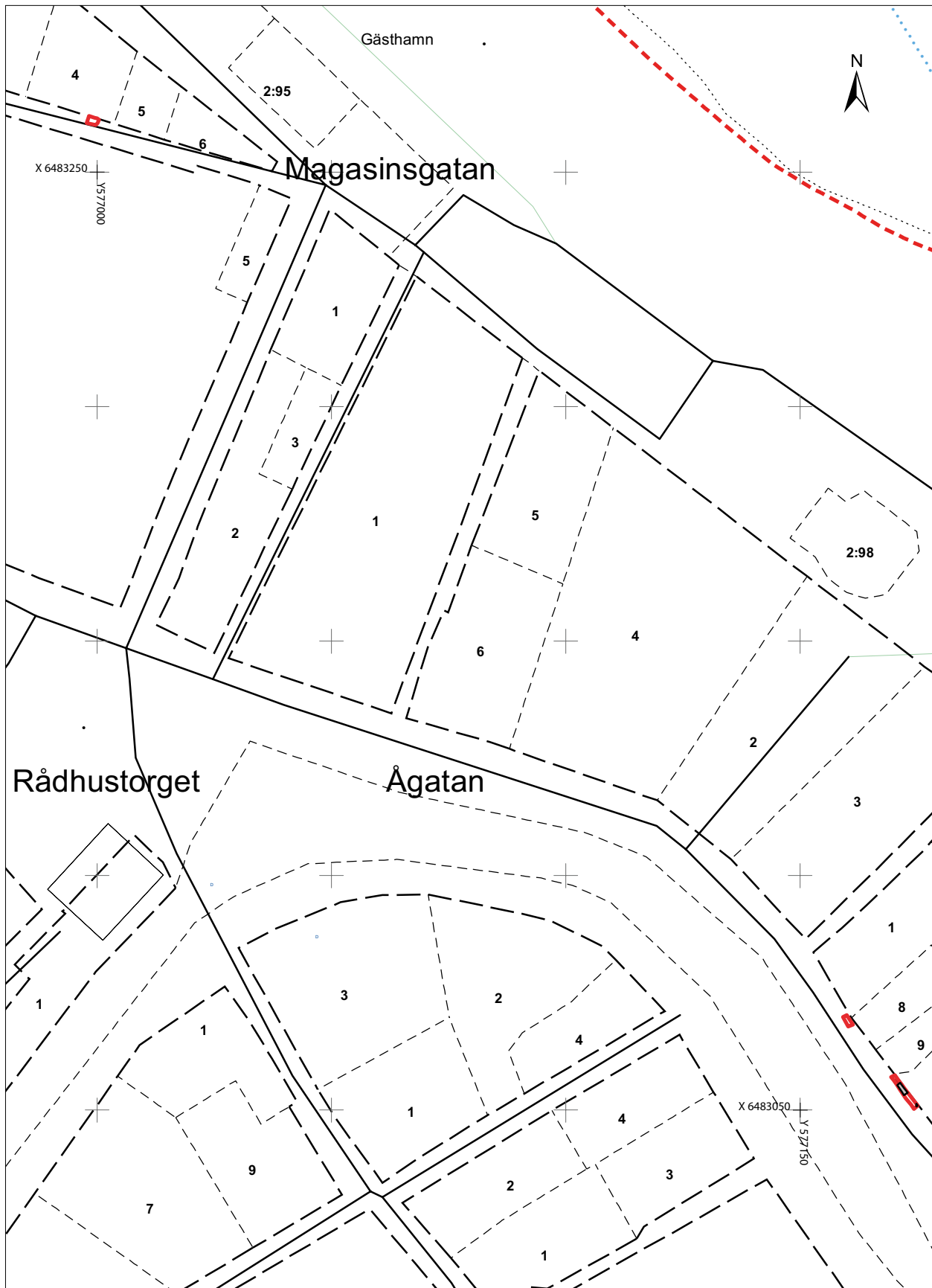
Figur 2. Undersökningsschakten i Magasins- och Ågatan markerade med röda rektanglar på utsnitt ur Fastighetskartan i skala 1:1200.