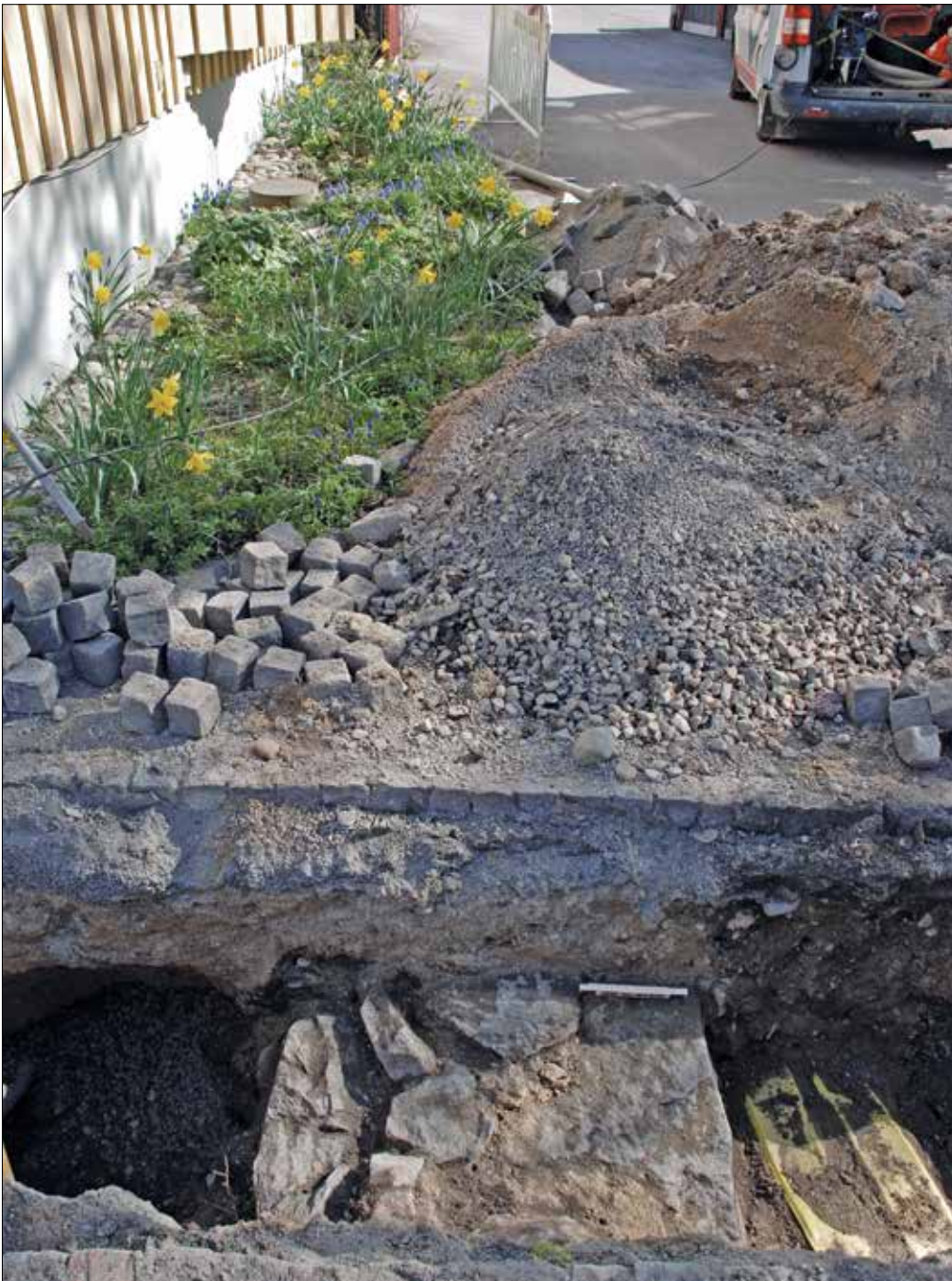
Figur 4. Den framgrävda muren fotograferad från Ågatan i sydväst. Läget för muren är vid dagens tomtgräns, vilket bör betyda att dagens fastighetsgräns är minst lika gammal som källarhuset.