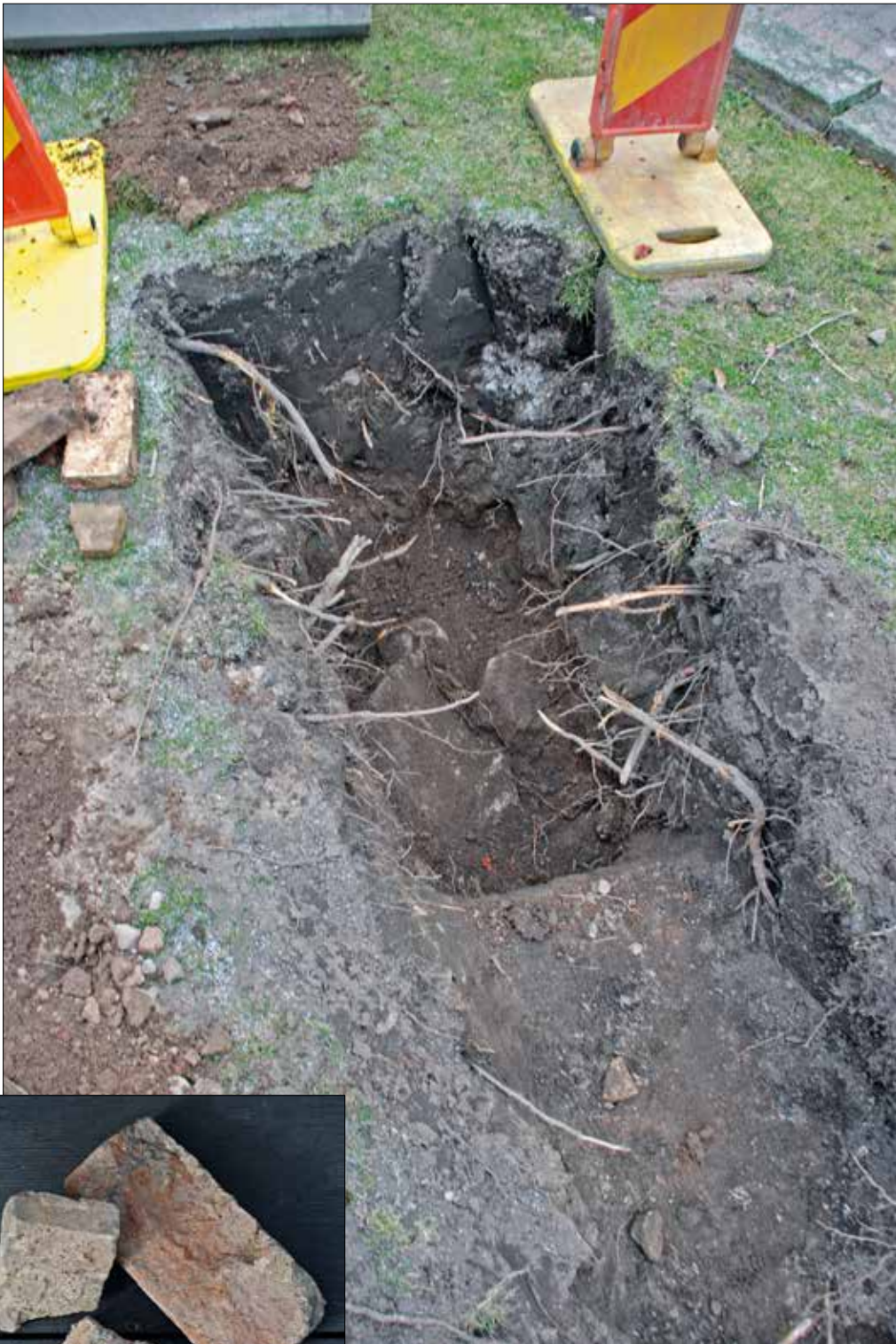
Fig 4 (ovan). Stenarna i schaktet OS241 sedda från nordost.