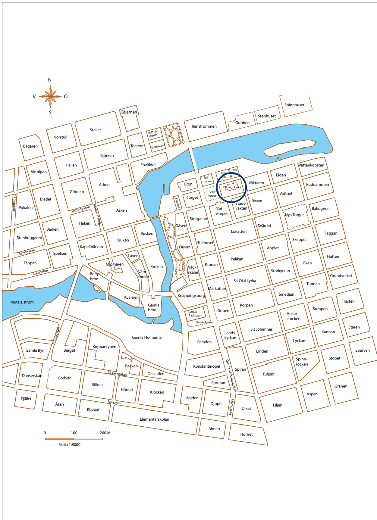
Fig 1. Förundersökningsområdet markerat med en blå cirkel på en karta från Medeltidsstaden 50 Norrköping. Kartan är kompletterad av Lars Östlin. Skala 1:8000.