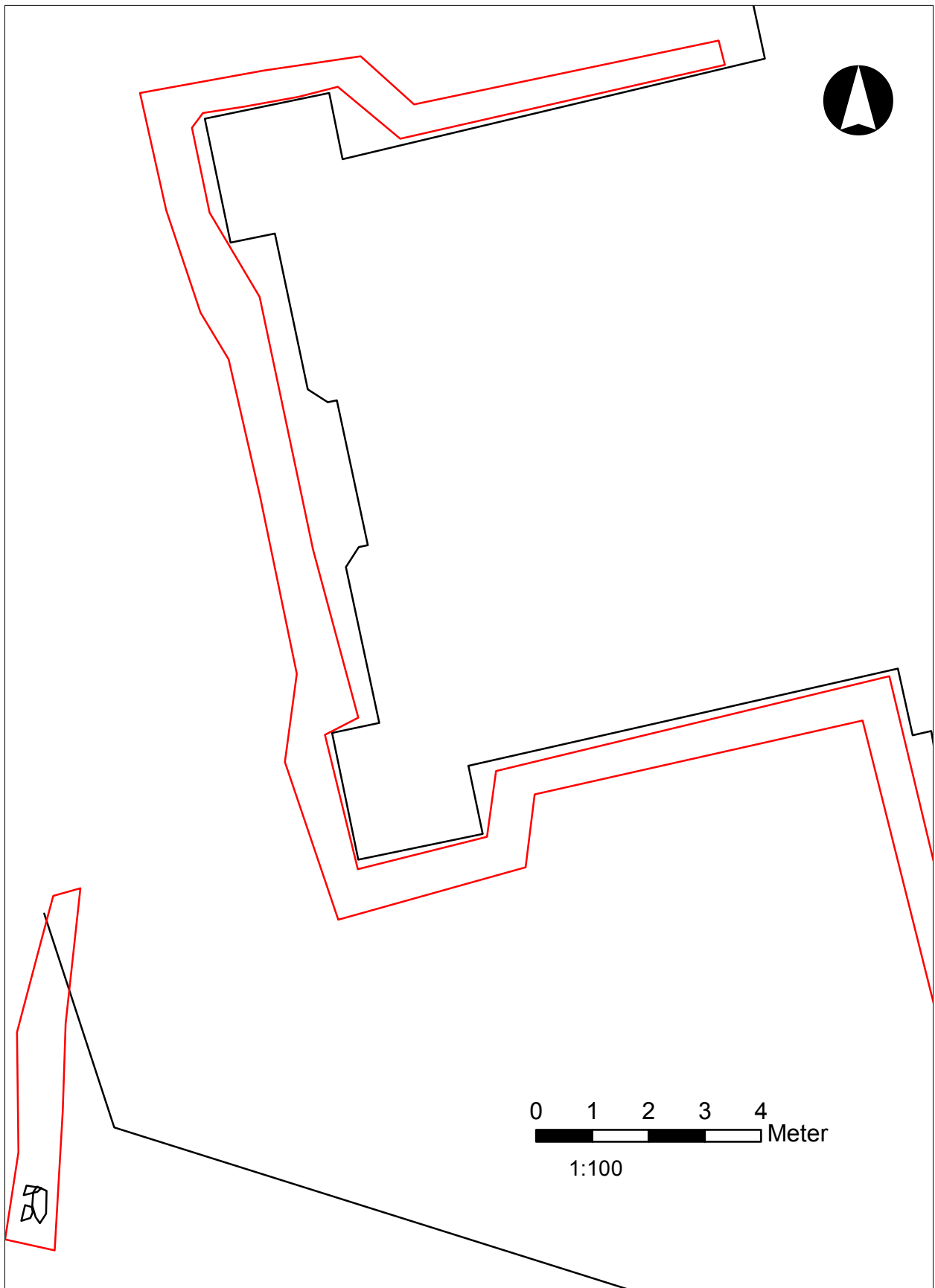
Fig 3. Planritning som visar kyrkans västra del och två av undersökningsschakten. I det mindre schaktet i sydväst, OS241, syns tre stenar vilka kan ingå i någon konstruktion. Dessa undersöktes dock inte vidare. Skala 1:100.