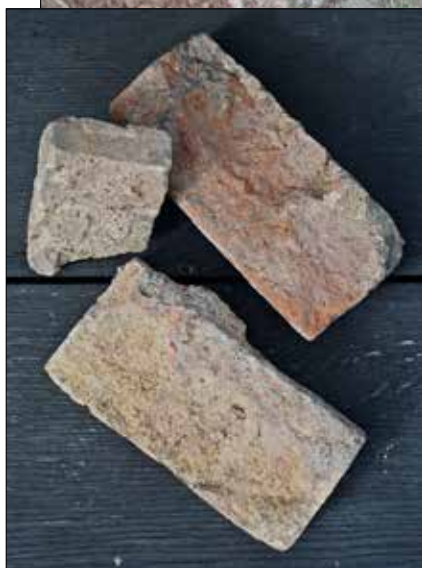
Fig 5 (t v). Lösfynd från det mindre schaktet sydväst om tornet i form av gult och rött småstenstegel.