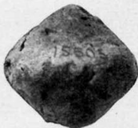
Fig. 115. Föremål av bränd lera från Ihre, Hangvars sn, Gotland. \frac{1}{4} .