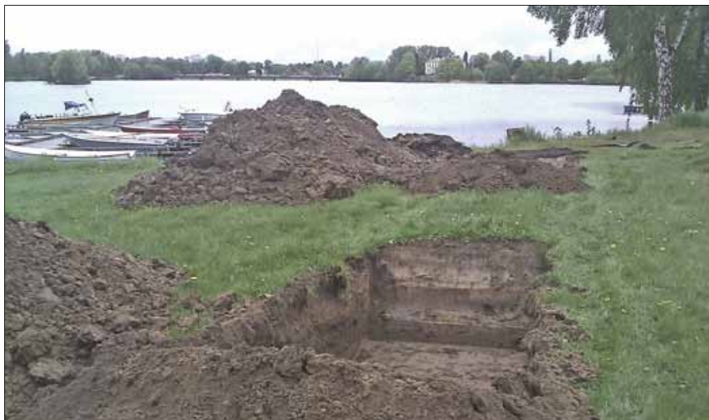
Fig 3 (ovan). Två sökschakt grävda vid Vattugränd. I bakgrunden syns Charlottenborgs slott.