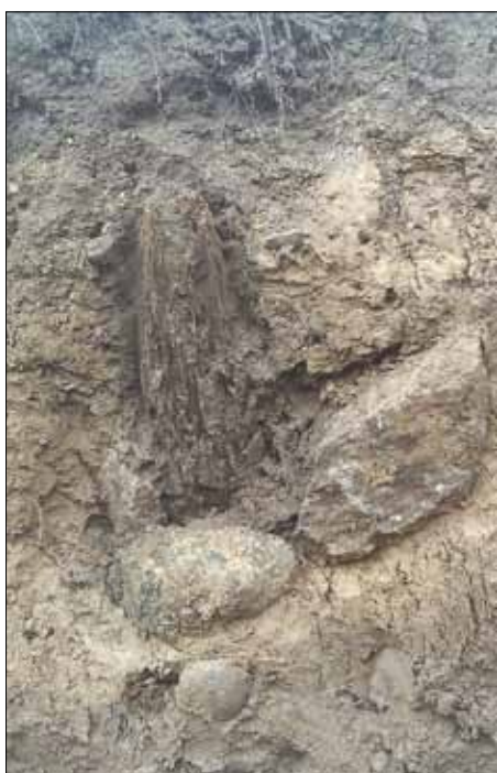
Fig 4 (t v). Ett stenskott stolphål med rester efter en stolpe av trä.

Den huvudsakliga frågeställningen till utredningen var att konstatera om lagskyddade lämningar kommer att beröras av den förestående exploateringen. Vid utredningstillfället bestod den berörda ytan av parkmark, i form av klippt gräsmatta. Tidigare har ett hyreshus av trä stått på platsen, längs med sträckningen av Strandvägen. Ytan närmast vattnet är även uppfyllt med upp till 1,5 meter tjocka fyllnadsmassor.