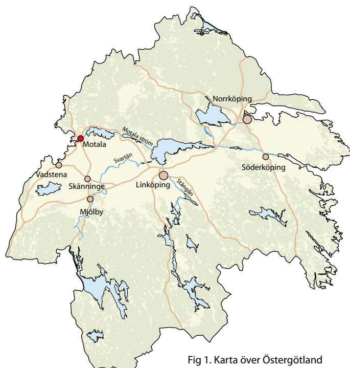
Fig 1. Karta över Östergötland med utredningsområdet markerat.