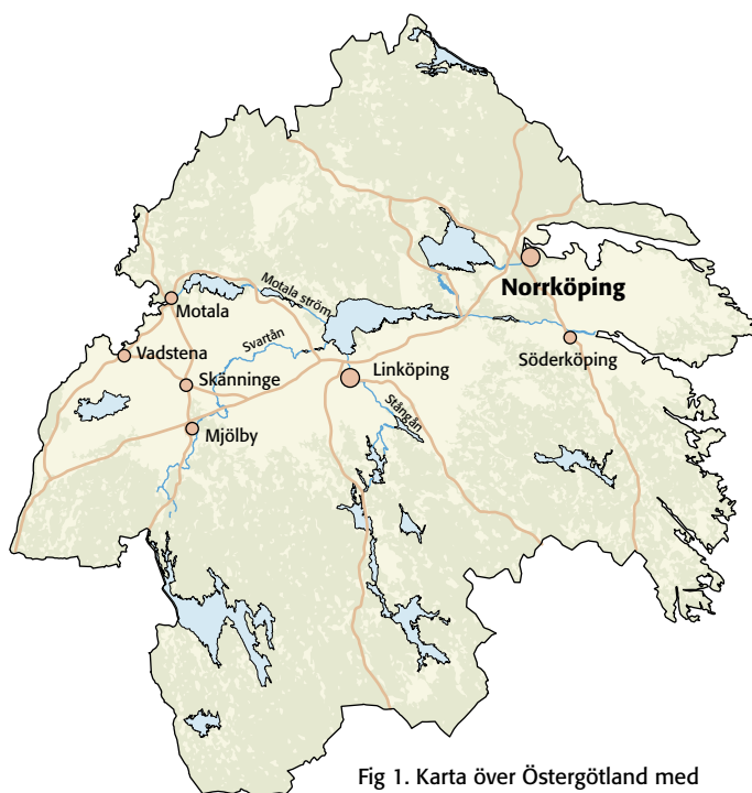
Fig 1. Karta över Östergötland med platsen för förundersökningen markerad.