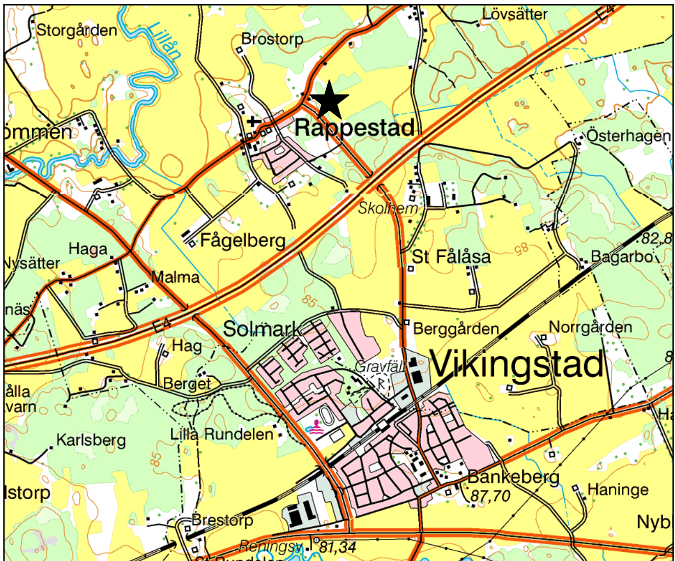
Fig 1. Utdrag ur Gröna kartan med utredningsområdet markerat.