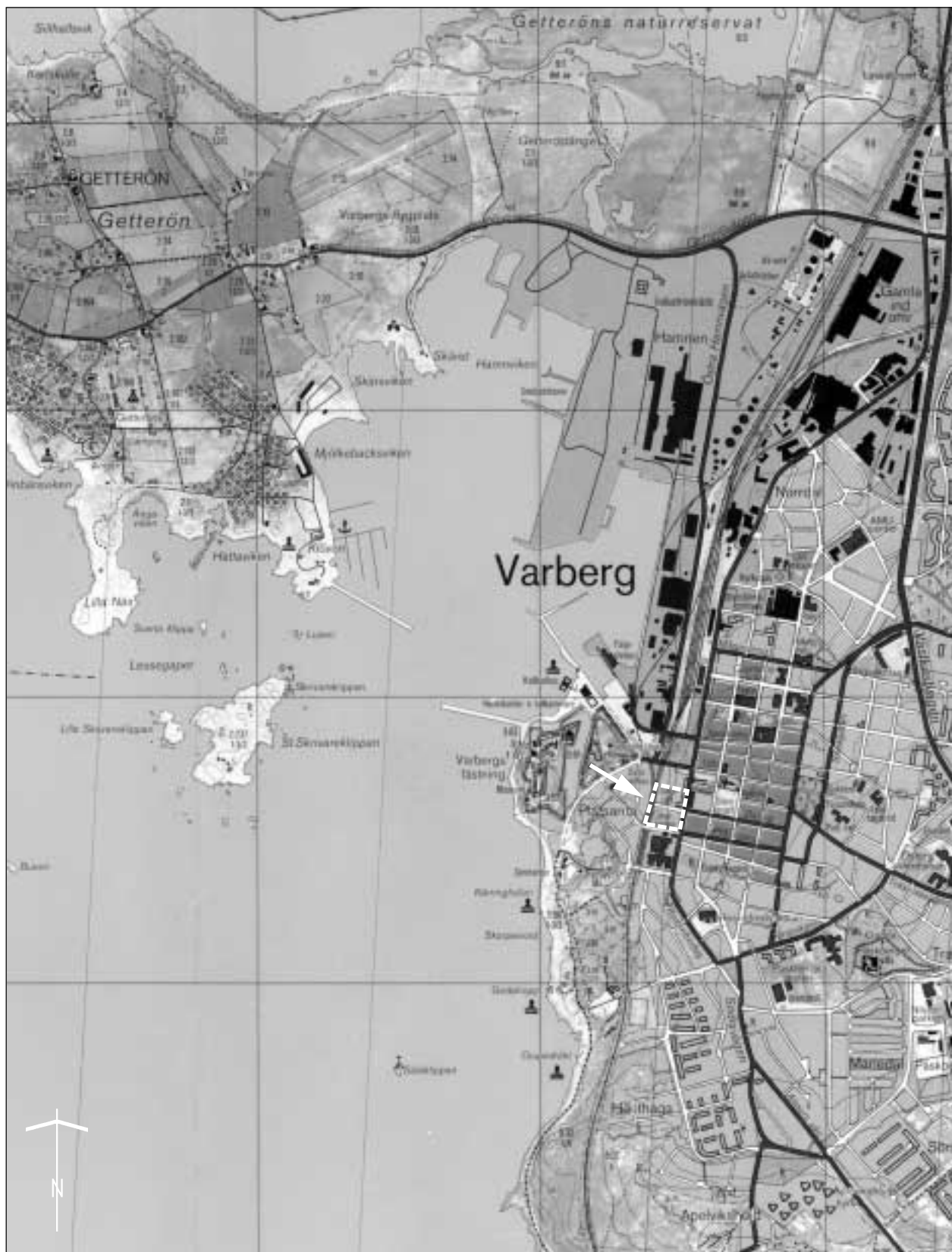
Fig. 2. Utdrag ur Gula kartan, blad Varberg 5B:66, med platsen för undersökningen markerad. Skala 1:20 000. Godkänd från sekretessynpunkt för spridning. Lantmäteriverket 2001-11-28..