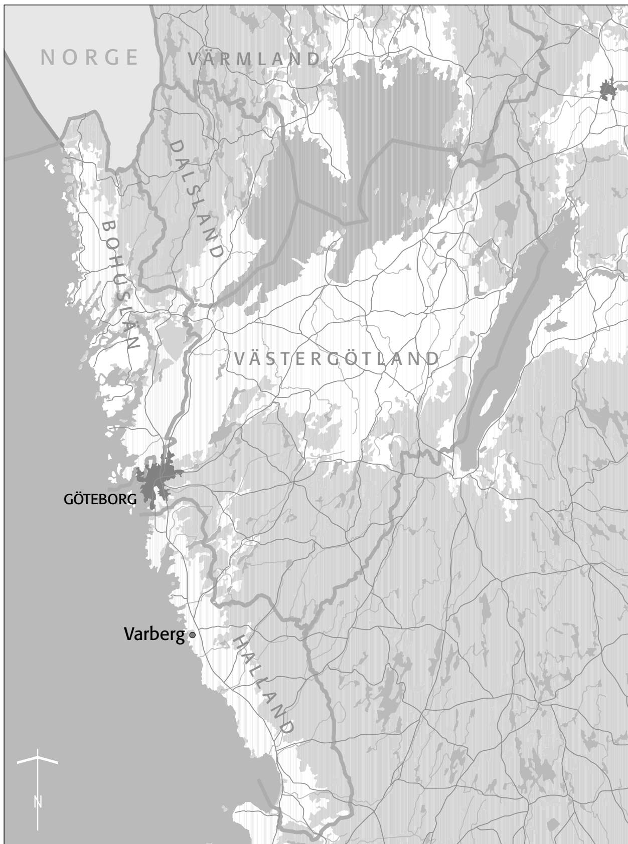
Fig. 1. Utsnitt ur GSD-Sverigekartan med platsen för undersökningen markerad.