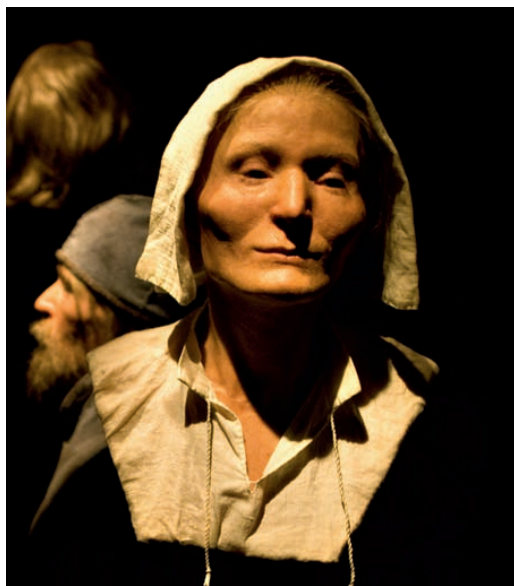
Fig. 2. Ansiktsrekonstruktion av skelett B, »Beata», i Vasamuseet i Stockholm. —Facial reconstruction of one of the dead from the Vasa.

besökande i Vasamuseet tillsammans med ansiktsrekonstruktioner (fig. 2).