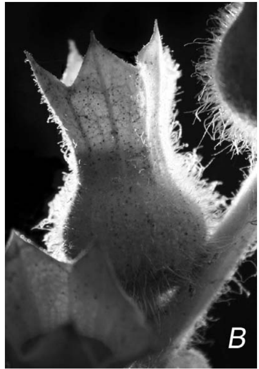
Fig. 1. a) Bolmörtsfrö från 1300-talets Skänninge. Fröet mäter ca 1,4 mm i diameter. b) Bolmörtens frökapsel innehåller i genomsnitt 350 frön. —a) Seed of henbane from 14th century urban strata in Skänninge. b) A henbane fruit contains about 360 seeds.

internationellt historiskt och arkeologiskt sammanhang. 3) Att längs vägen reda ut några myter och missuppfattningar.