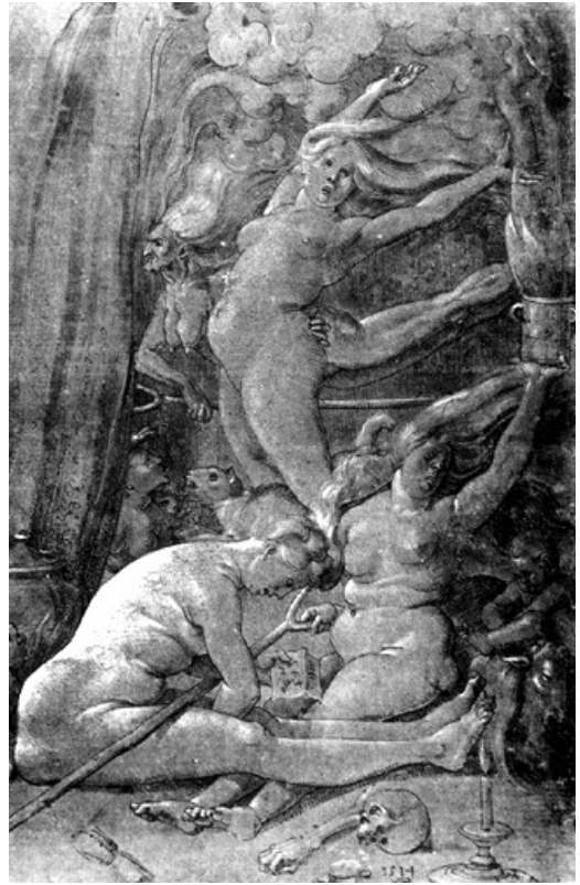
Fig. 4. Pornografiskt häxmotiv av Hans Baldung Grien (1514). Notera hur kvinnan i förgrunden tycks smörja sig på insidan av låren. – Pornographic depiction of witches by Hans Baldung Grien (1514). Note how the woman in front appears to be anointing the insides of her thighs.

Utifrån det arkeobotaniska materialet kan svaret tyckas enkelt: bolmörten är vanlig, ergo tillgången var god, ergo odling var onödig då örten fanns tillgänglig i ogräsfloran. Men resonemanget faller på att det inte tar hänsyn till eko-