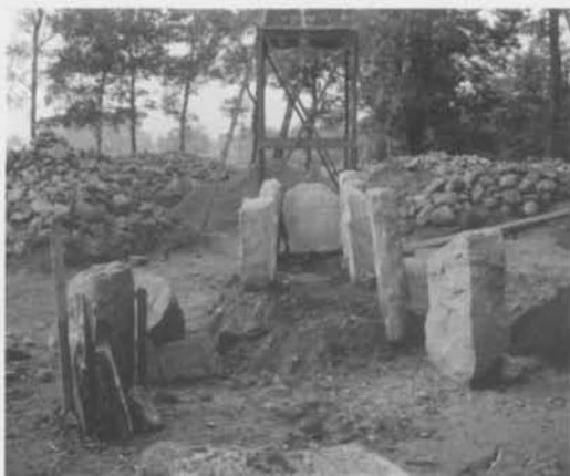
Fig. 1. De diskuterade människobenen påträffades under utgrävningens sista dagar då innehållet i Bredarörs hällkista undersöktes. Då detta foto togs hade man börjat undersöka lagret där människobenen påträffades genom att kniva sig genom kistan från söder mot norr. —The human bones under study were found in and around the bottom fill layer of the stone cist with rock engravings at Kivik.