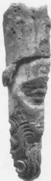
Fig. 3. Fragment av träskulptur, funnet i Fornåsa kyrka, Östergötland. — Fragment of a wooden sculpture from Fornåsa Church, Östergötland.

någon av S. Martins huvudkultorter, Tours eller Amiens. S. Martin hör till de i hela Skandinavien medeltiden igenom aktuella helgonbiskoparna; redan år 1126 nedlade man sålunda relikier av honom i ett av Lunds domkyrkas kryptaltaren och i stadens jord har påträffats ett pilgrimsmärke från romansk tid med vad som kan antagas vara en primitivt utformad bild av Martin klyvande sin mantel (LUHM inv.-nr 28657). Fornåsamärkets detaljer kunna i vart fall icke inpassas i framställningsschemat för övriga här i Skandinavien kända helgonbiskopar, varken för den ständigt återkommande Nikolaus av Bari 2 eller den under senmedeltid så ofta framställde Erasmus; icke heller de svenska helgonen Sigfrid och Henrik kunna tjäna som förklaring; den sistnämndes attribut är visserligen oftast hans baneman Lalli, framställd såsom dvärg i jämförelse med helgonet, men han brukar placeras såsom underliggare och icke som upprättstående följeslagare.