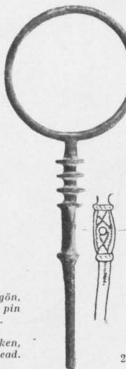
Fig. 2. Ringhuvudnål av brons. Paiküla, Kärla socken, Ösel. Ca 5/9. — Bronze pin with ring-shaped head. Paiküla, Kärla parish, Ösel.

ifrån båtgrav 7 vid Valsgårde i Uppland, vilka Greta Arwidsson 4 identifierat som importstycken ifrån Memelområdet; graven tillhör andra hälften av 600-talet.