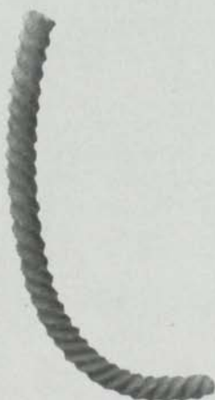
Fig. 5. Fragment av bronsalsring. Helgön, Ekerö, Uppland. 2/3. — Fragment of bronze torque. Helgön, Ekerö, Uppland.

Vår nål från Helgön har profilering av sådana skivor. De närmaste paralleller till denna nål, som jag känner, äro estniska, den allra närmaste är den i fig. 2 återgivna nålen ifrån Paiküla, Kärla socken på Ösel. Vi se på den senare nålen under huvudet tre skivformiga profileringar, liksom på vårt exemplar från Helgön med mittskåra. Någon silvertråd är i varje fall icke bevarad på Öselnålen, lika litet som på det svenska exemplaret. Den förra nålen har ungefär cirkelrunt huvud; mera ovalt sådant som Helgönålen äga dock andra estniska nålar, t. ex. Ariste, a. A. pl. II fig. 2, 3, 5. Öselnålen torde tillhöra tiden framemot eller omkring år 800.