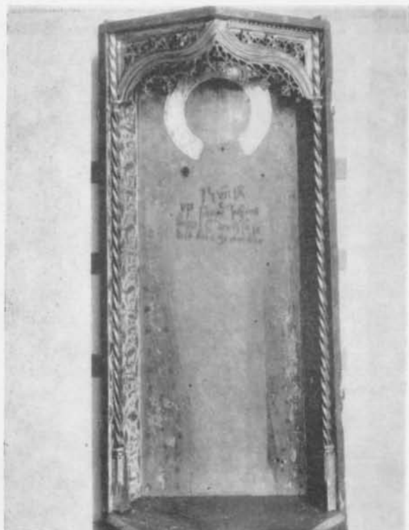
Fig. 1. Dorsalet till madonnaskåpet från Haga kyrka, Uppland. — Dorsal of the Madonna shrine from Haga Church, Uppland.

verkligen har fog för sig, som man lätt gör inför åtskilliga av de svenska senmedeltida kyrkoskulpturerna av nordtyskt kynne, nämligen, att det var inom Sveriges gränser som åtskilliga av de tyskfödda och tyskt skolade skulptörerna utförde sina beställningar för svenska kyrkor. Hagaskåpets lågtyska sammanhang framgår f. ö. icke blott av skulpturens stilistiska drag och den ovan citerade inskriften, även orden på skulpturens sockel anger detta: S. MARIA firgene.