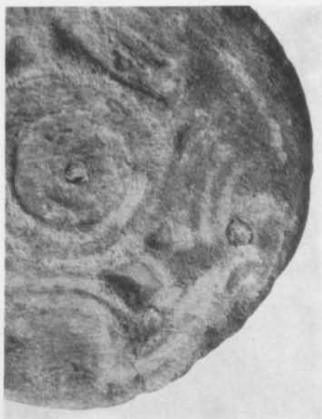
Fig. 4. Detalj av fibulan fig. 1. Förstorad. — Detail of the fibula shown in Fig. 1. Enlarged.

Till det magra bohuslänska fornsaksbeståndet från merovingertiden-venedeltiden 3 utgör Tossene-spännet ett välkommet och i all sin enkelhet särpräglad tillskott.