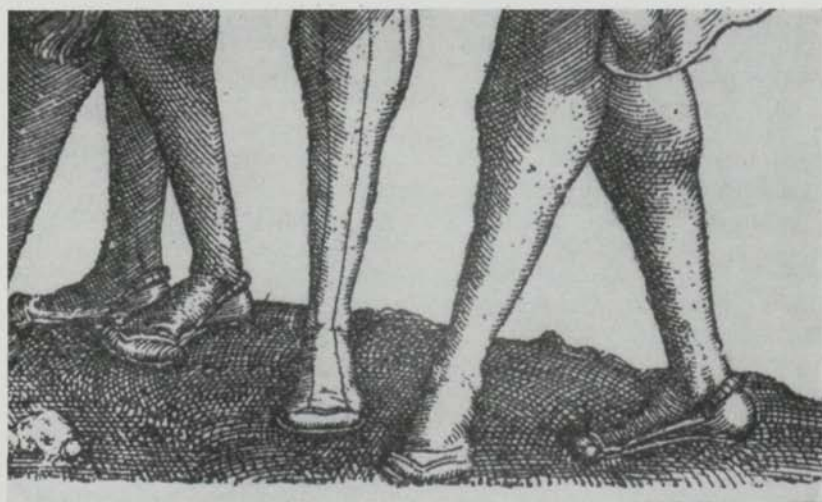
Fig. 2. Tyska oxmuleskor med spiralfjäderliknande hälvulst. Ur Heinrich Aldegrevers kopparstick »Die Hochzeitstänzer» 1538. Efter Hirth. — German shoes with pieces, similar to fig. 1 at the heels. From »Die Hochzeitstänzer», engraving by Heinrich Aldegrever in 1538. After Hirth.

också förmodat, att denna sorts sko skulle ha varit fastsydd vid hosan eller strumpan. Detta har emellertid såvitt känt icke kunnat beläggas. Tvärtom visa skulpturer med fot och sko detaljerat återgivna, att oxmuleskor av denna typ höllos fast på foten tack vare den spänning, som bakstycket och det mycket korta ovanlädret åstadkommo.