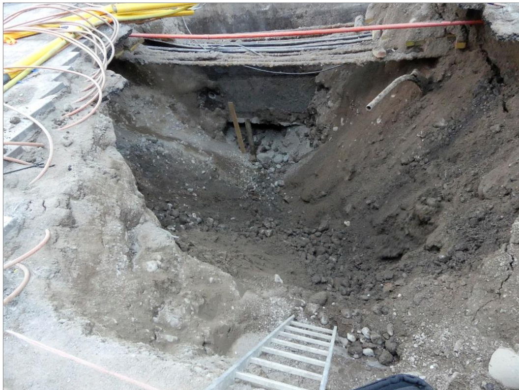
Figur 4. Det 4 m djupa schaktet, med inrasande sidor av omrört åsmaterial i form av grus och sten. Foto mot fastighet Dragarbrunn 14:3 mot sydöst.