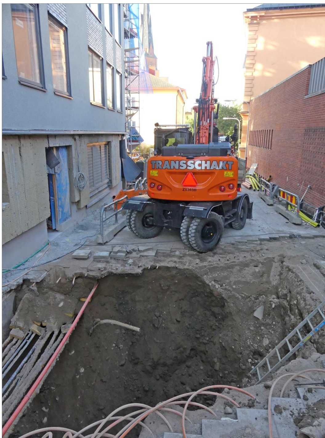
Figur 5. Schaktets läge i Klostergatan. Foto mot sydväst, Robin Lucas, Upplandsmuseet.