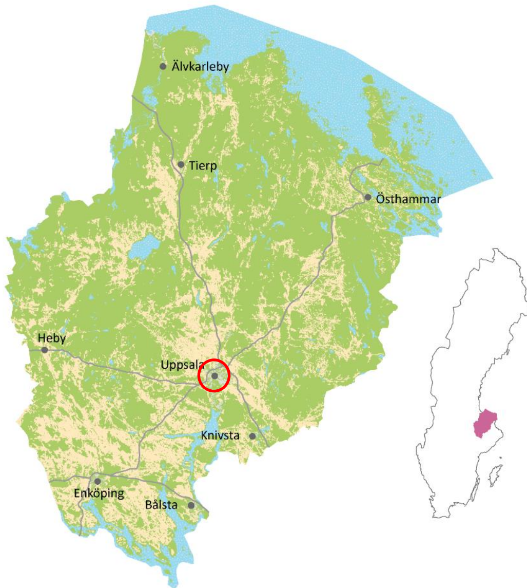
Figur 1. Uppsala län med det aktuella området markerat.