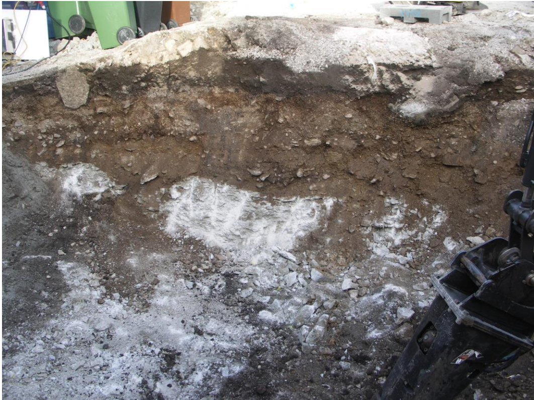
Fig. 3. Vy över norra schaktväggen. Berget har bilats ned en halvmeter inför nybyggnationen. En kantställd kalkstensflisa i schaktets överkant till vänster, är ett stöd i en grävd grop till en torkställning för tvätt. Från söder.