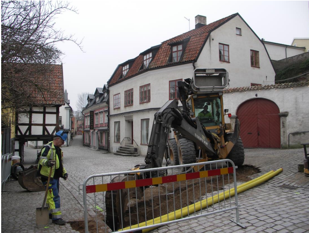
Fig. 2. Vy över Södra Kyrkogatan/Smittens backe mot fastigheten Vinkeln 28. Foto från västsydväst.