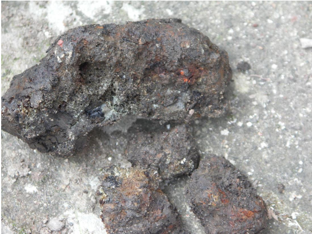
Fig. 4. Fyndbild. Enstaka bitar smidesslagg av medeltida karaktär påträffades.