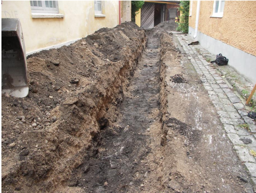
Fig. 3. Schaktet förlades i en lång gårdsinfart, bland annat till ett garage i fonden. Från nordnordväst.