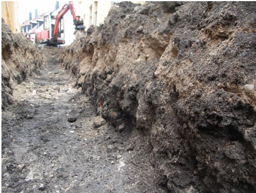
Fig. 3. Under ett ca 0,3 meter tjockt bärlager av grus, vidtog ett kulturlager. Från sydsydost.