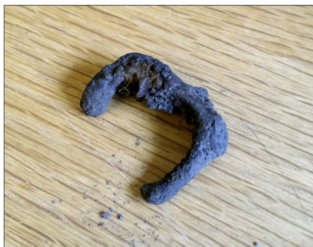
Figur 3. Brodd av järn funnen i schakt 7.