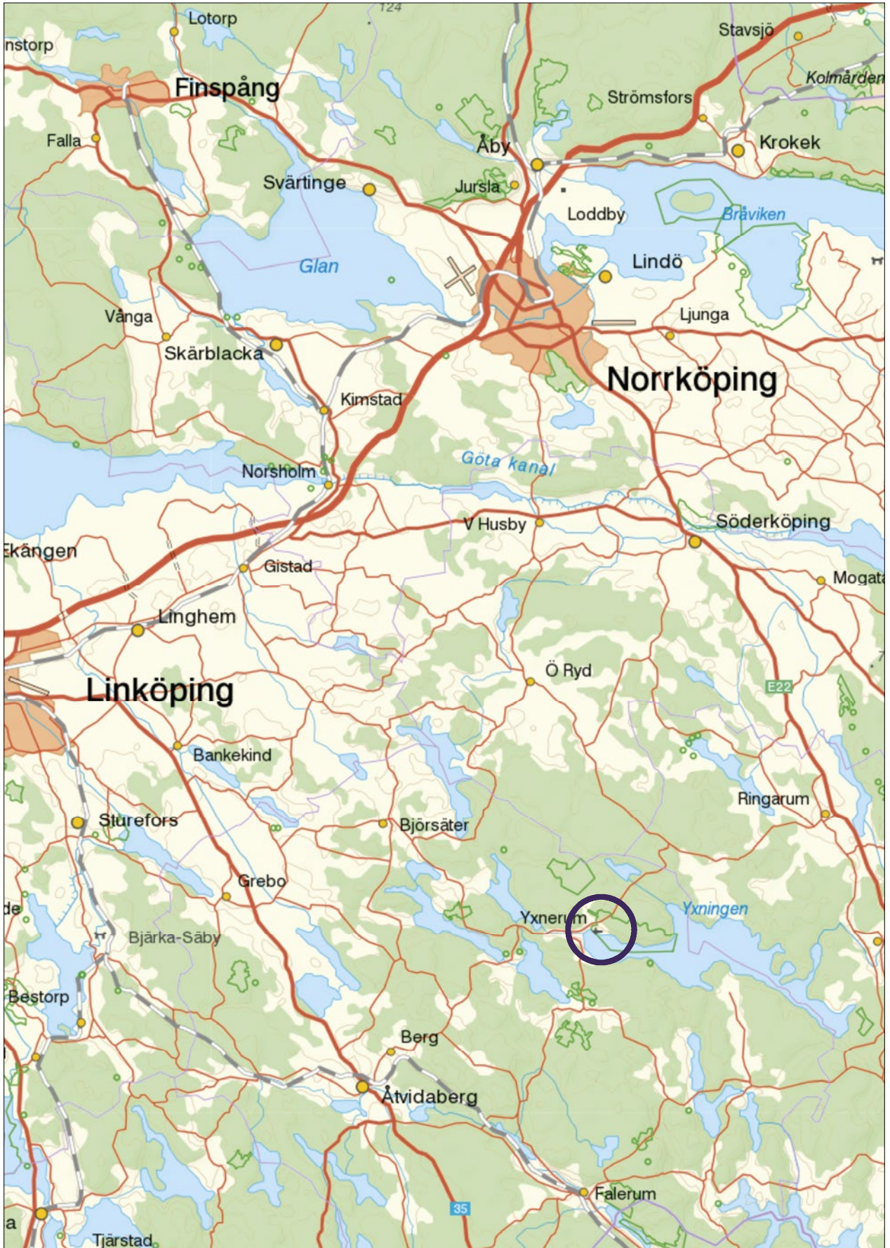
Figur 1. Undersökningens läge markerat på utsnitt av Sverigekartan. Skala 1:300000.